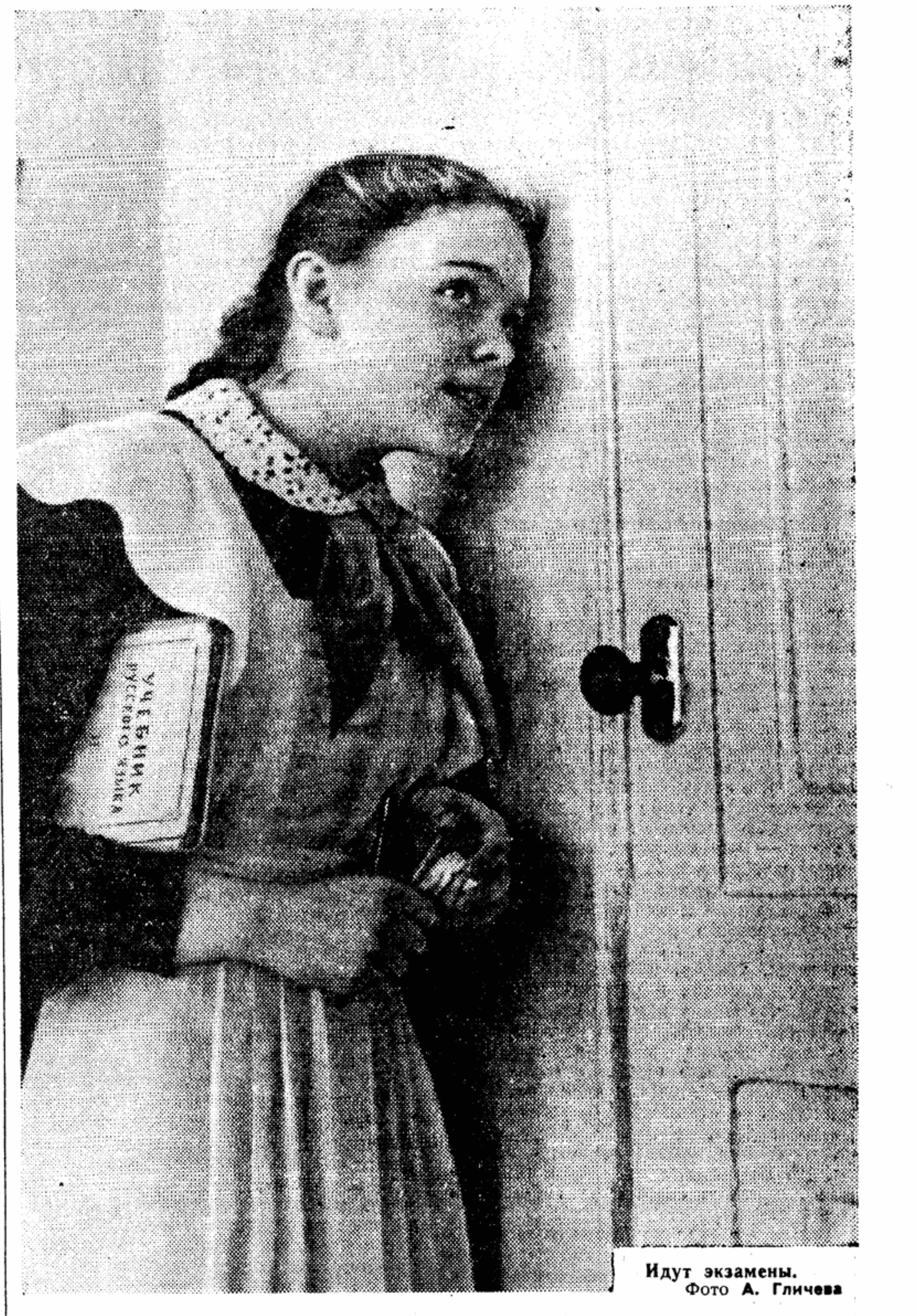
Идут экзамены.

Вот так, например, сказал мне обо всем этом один крестьянин, друг детства: — Я как раз собирался идти копать картошку, когда радио сообщило, что русские запустили космическую ракету. Ну, пришел я в поле, взял лопату и давай копать. Счищая руками землю с картошки, и вдруг меня осенило: вот я только руками собираю картошку, как делаю это и отец мой, и дед, все близкие — это и отец мой, и дед, все близкие — это и отец мой, и дед, все близкие, так и Луна приближается. Значит, техника теперь такая, что мы и космос скоро завоюем. Грустно стало мне, пошел домой. Хочешь верь, хочешь нет, но только с той ночи впер-