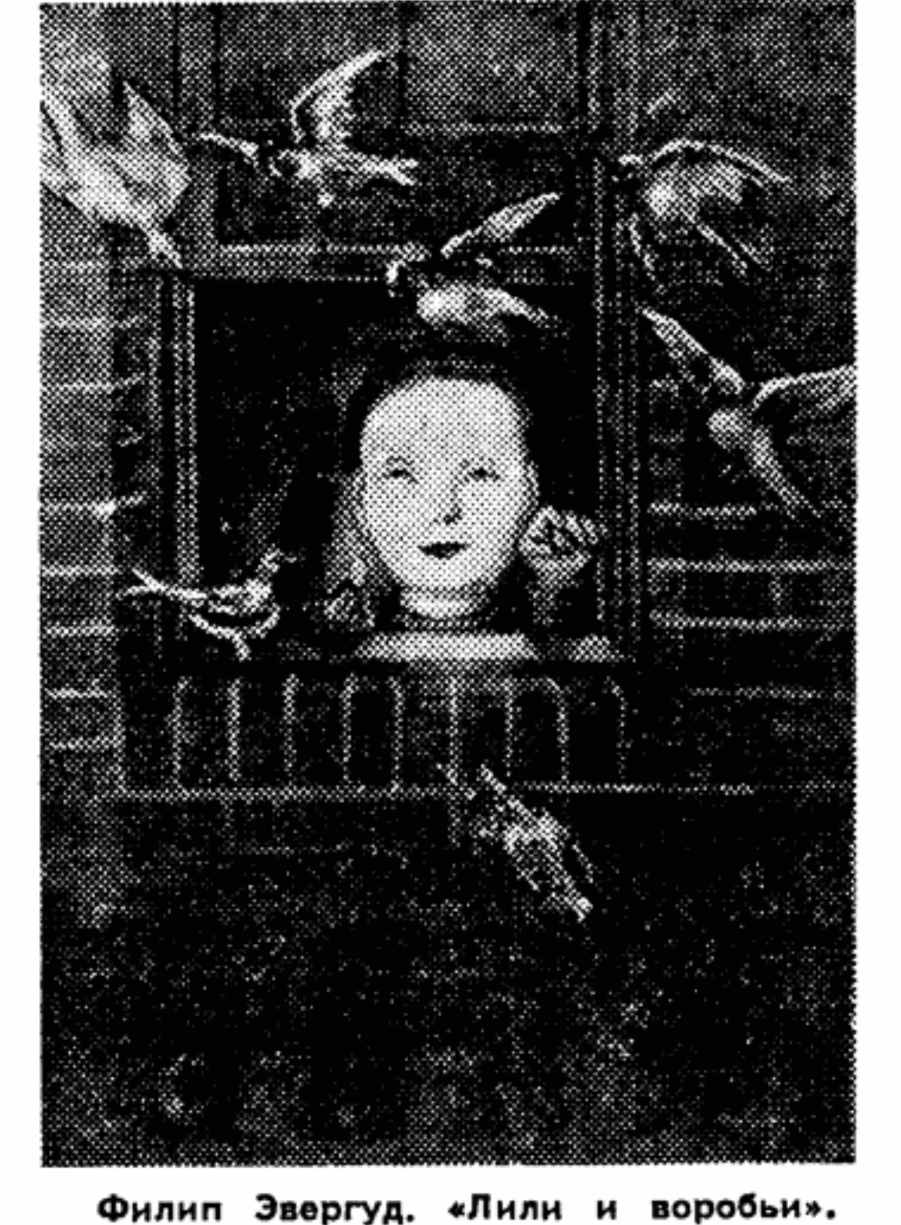
Филип Эвергуд. «Лили и воробьи».

Мы публикуем сегодня репродукции картин Бена Шана и Филипа Эвергуда.