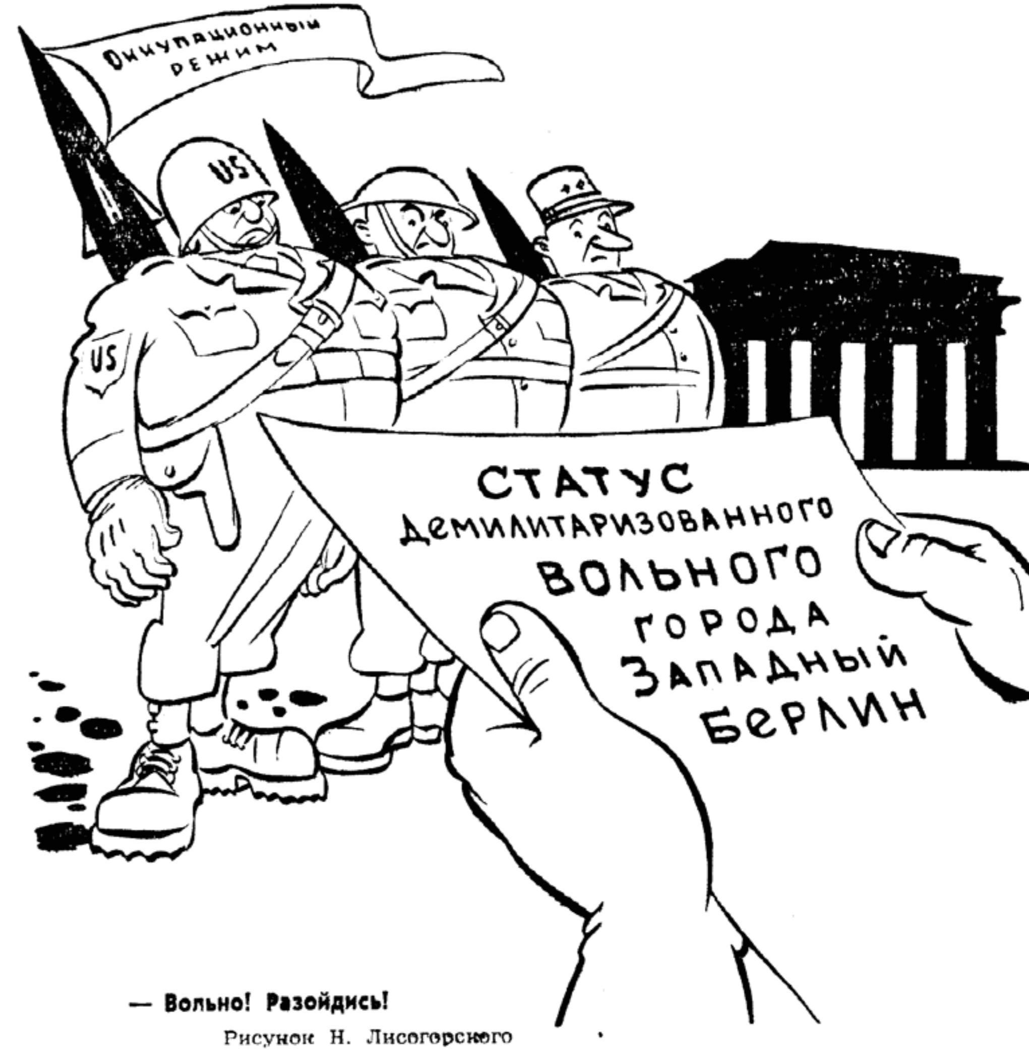
— Волю! Разойдись! Рисунок Н. Лисогорского