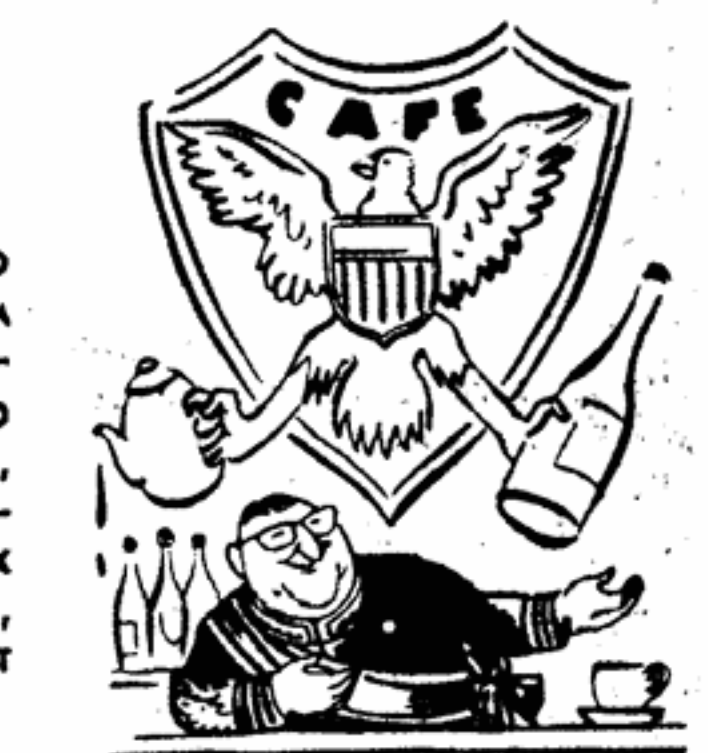
ном городе есть по крайней мере парочка консулств.

Все это продается по более низким ценам, чем в итальянских магазинах. Посольство, согласно существующим правилам, освобождено от уплаты таможенных пошлин и других сборов; пользуясь этим, оно успешно конкурирует с местными лавочниками. Итальянские газеты опубликовали письмо группы торговцев. Они сообщают, что обращались в министерство иностранных дел Италии с жалобой на незаконную коммерческую деятельность американского посольства в Риме, подвешивающую мелкую торговлю. Однако — безрезультатно. Комментируя все это, итальянская газета «Лаззере» иронически предсказывает, что может произойти дальше. В Риме, «двойной столице» — Италии и Ватикана, пишет газета, посольство больше, чем других: в каждом крупном городе есть по крайней мере парочка консулств. Если американскому примеру последуют другие, как это часто бывает, то в один прекрасный день мы очутимся в совершенно новом дипломатическо-коммерческом мире. Мы будем читать неоновые рекламные «Лучшие ткани» — в английской посольстве, «Новое во французском посольстве: наконец коньяк стал доступен всем»... Итальянские торговцы, уплаты долги по налогам, закроют свои лавочки, и кризис мелкой торговли будет разрешен раз и навсегда!