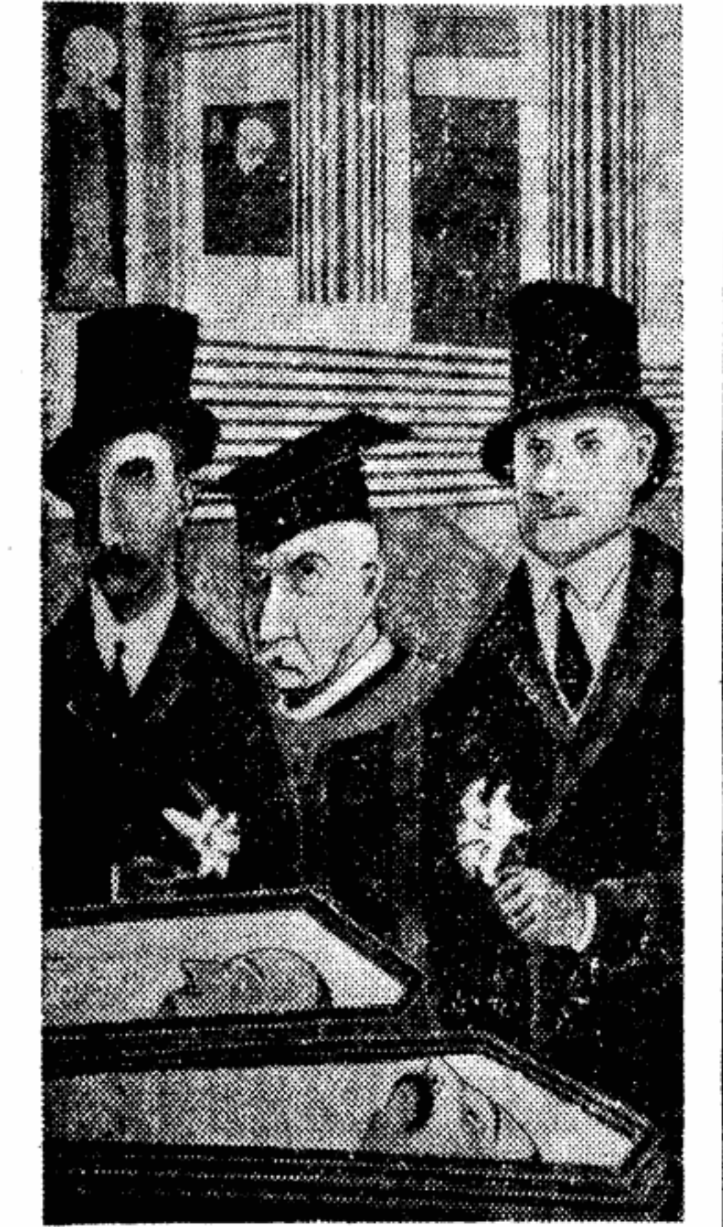
Бен Шан. «Мушкетеры Санко и Ванцетти» (1932 г.).

Недостойный выход к о против памяти Томаса Манна, общероссийской гордости немецкой литературы, любящего реакционером, продемонстрировал свой родной душ с Гитлером и Гоббсом. Это этого не знал, теперь будет знать, — пишет Берлинская газета «Моргенштерн» — опровержение, гнездо Гитлера и компании и гнездо партии Аденаурера — это и то же... Если корифей литературы подвергается в Боннской республике дискриминации, то всевозможные литературные нули из идеологического штаба Гоббса возмущаются.