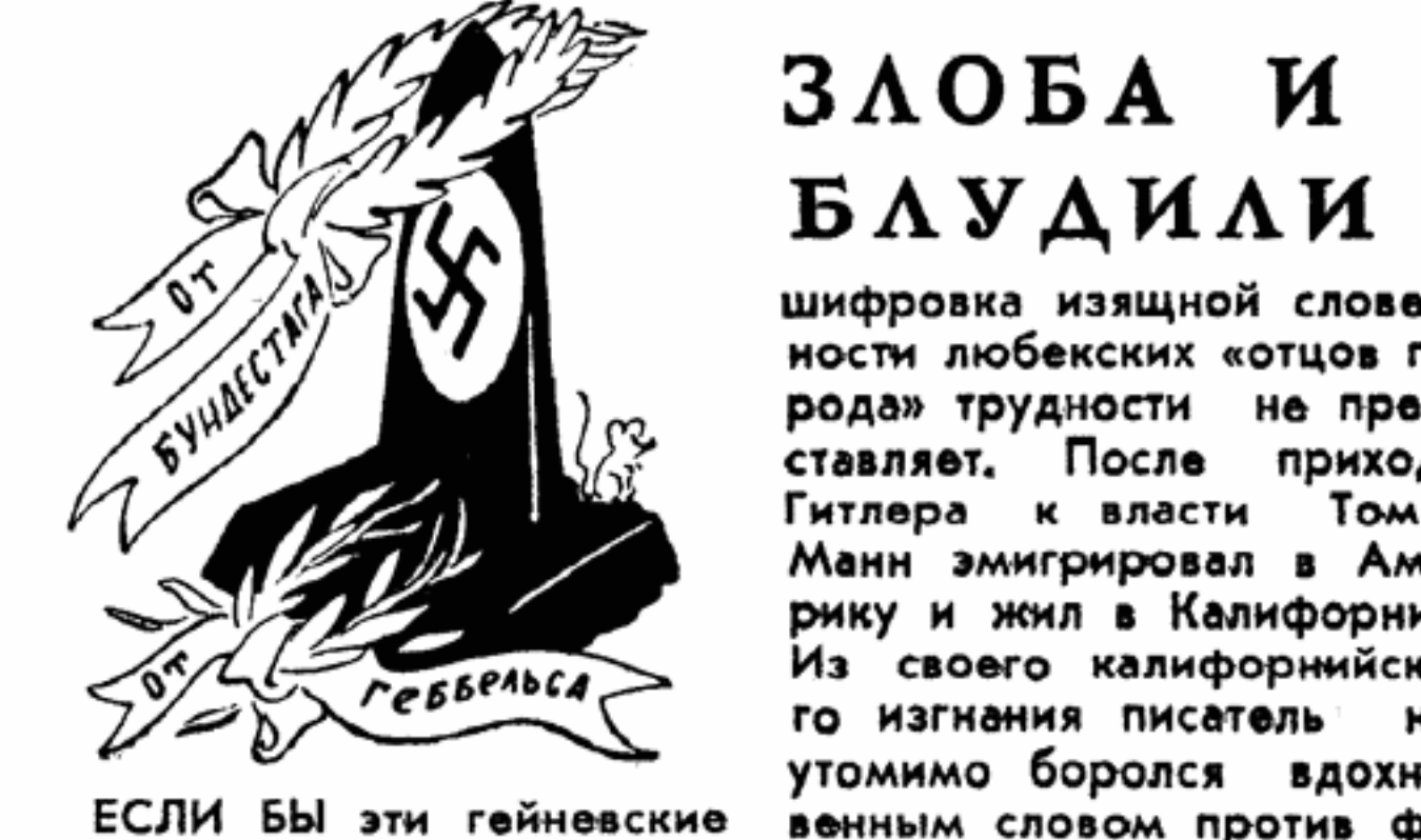
Если бы эти геинские строны были высечены на фронтоне здания сената старого западногерманского города Любека, то они могли бы послужить точным символом этого учредительного...

Не так давно мы писали о том, что филистеры из городского собрания депутатов Хельпенгайма отвергли предложение назвать одну из улиц именем Гая Гейне. Как выяснилось, хельпенгаймские реакционеры не одиноки. У них нашлись единомышленники в Любеке. Сенат Любека демонстративно отклонил идею присвоить местной гимназии имя Томаса Манна. Это позорное решение усугубила еще более позорная мотивировка. Дело, оказывается, в том, что во время второй мировой войны Томас Манн «попал в свое собственное гнездо». Рас-